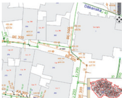
Ukázka vodovodní a kanalizační sítě v Táboře – podrobná data sítí v řešení Autodesk Infrastructure Map Server