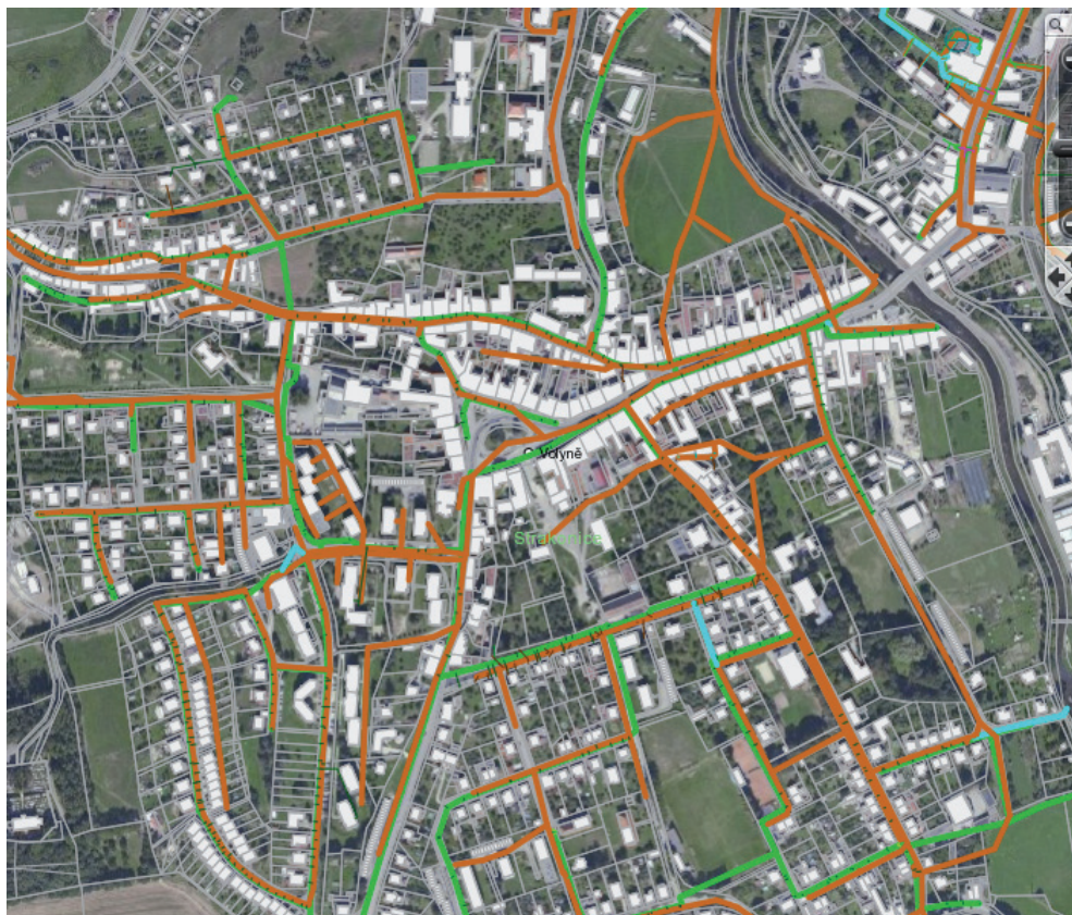
Vodovodní a kanalizační síť ve Volyni – současné zobrazení ortofota a digitálního katastru

Moderní technologie ve společnosti AQUASERV přirozeně propojují svět projektantů s geoprostorovými daty a přestavby polyfunkčního centra.