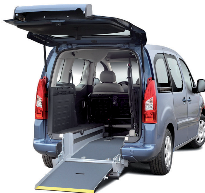
API CZ – Peugeot

API CZ je česká firma se světovým významem – na jejím úspěchu se od samého založení zásadně podílí software Autodesk Inventor.